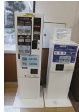
正面ホール 自動販売機・精算機