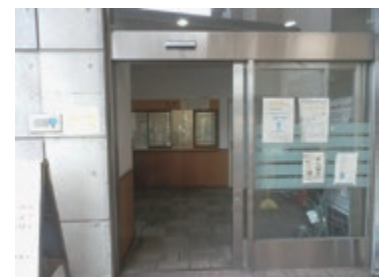
時間外／時間外受付