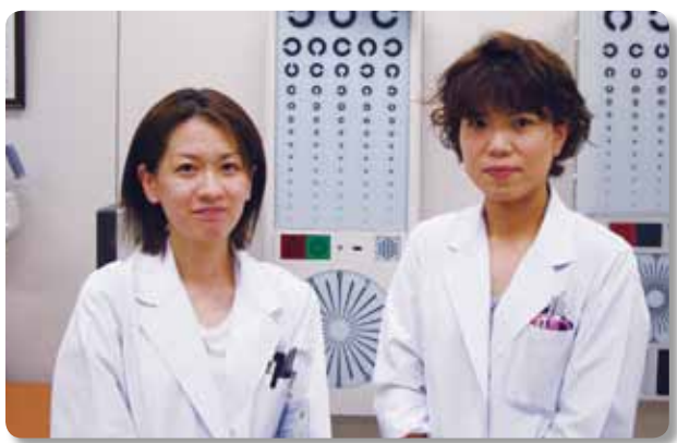
私たちが視能訓練士です

1929年にイギリスで誕生し、日本では1971年に国家資格として認定されました。当初は斜視、弱視の視能訓練分野のみを業務としていましたが、その後1993年に視能訓練士法が改定され、それまでの業務に加えて眼科における一般検査(視機能検査)が行えるようになりました。その検査結果が適切な治療方針・診断につながることから、現在では大学病院からお