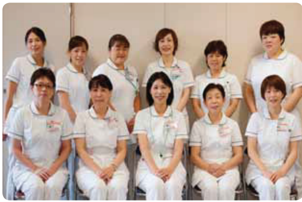
私たちがお待ちしております。