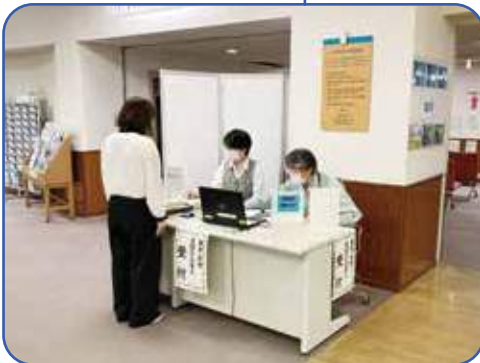
面会の受付場所はこちからです