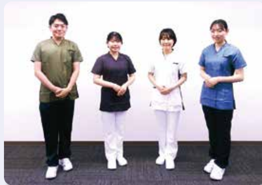
左から、薬剤師、看護師(日勤)、看護師(夜勤)、臨床検査技師

看護師は日勤と夜勤で着用する上着の色を変えます。職員同士が一目で日勤の職員か夜勤の職員か分かり、スムーズに業務の引継ぎを行うためです。日勤の職員はパールの上着を、夜勤の職員はホワイトの上着を着用します。 また、ジェンダーレスを意識し、男女共通のユニフォームを多くの部署で採用しました。患者さんにも安心していただけるよう、グリーンやブルーといった優しいカラーも取り入れています。