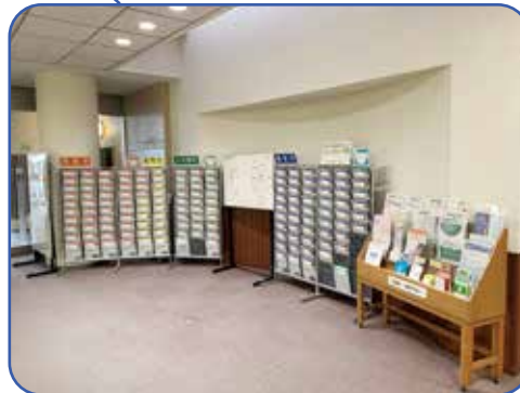
開業医さんの情報が1か所にまとまっています

看護師は日勤と夜勤で着用する上着の色を変えます。職員同士が一目で日勤の職員か夜勤の職員か分かり、スムーズに業務の引継ぎを行うためです。日勤の職員はパールの上着を、夜勤の職員はホワイトの上着を着用します。 また、ジェンダーレスを意識し、男女共通のユニフォームを多くの部署で採用しました。患者さんにも安心していただけるよう、グリーンやブルーといった優しいカラーも取り入れています。