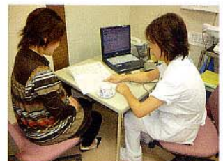
④助産師とのおはなし