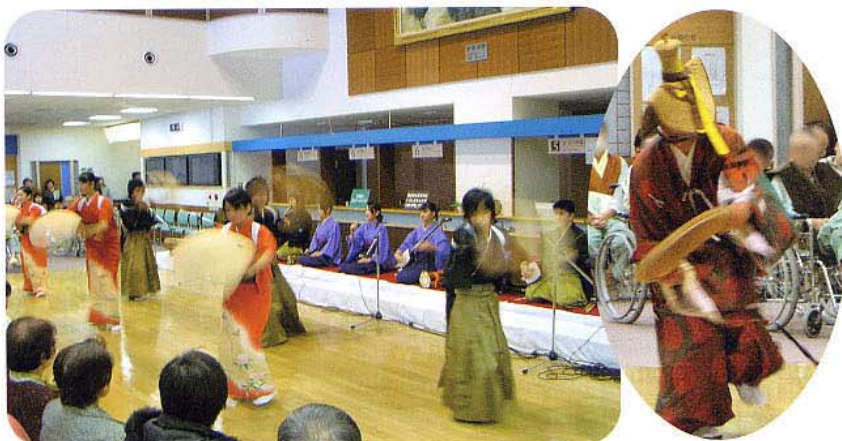
こきりこ踊りと麦屋節 (第28回おあしすコンサートより)