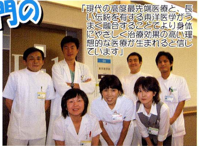
東洋医学科スタッフです

「現代の高度最先端医療と、長い伝統を有する東洋医学がうまく融合することでより身体にやさしく治療効果の高い理想的な医療が生まれると信じています」