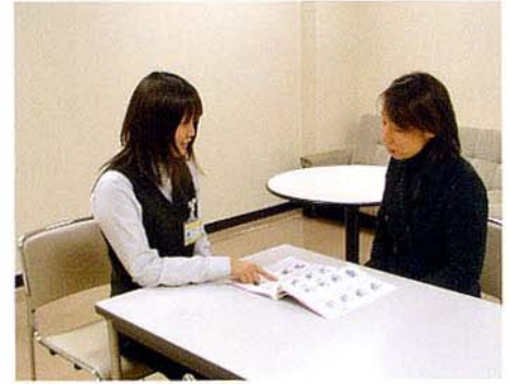
地域医療連携室のスタッフが、さまざまな相談に応じます