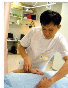
両手の脈を診るのが特徴のひとつです