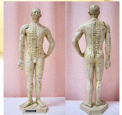
経穴人形(名前募集中です) 経路に沿って経穴があります

東洋医学は、現代医学とは違う視点から心身をとらえますので、一般的な病名にかかわらず「体調が悪い」と感じられている患者様は、みな治療の適応になります。しかし、鍼灸治療だけで何でも良くすることは難しく、漢方治療や現代医学との連携により力を発揮できると感じています。