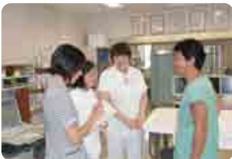
病棟での医師・社会福祉士・リハビリスタッフ・看護師の話し合い