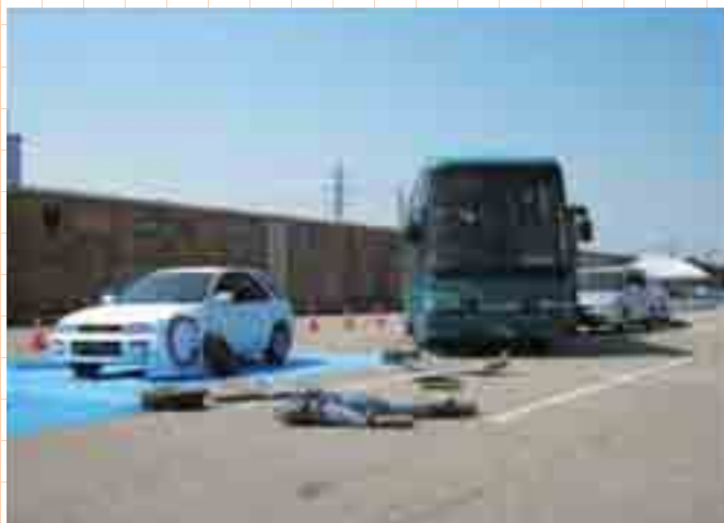
訓練の様子（平成24年8月）

今回の指定を受け、当院は災害時の市民の皆様の生命を守るため、さらなる災害時医療体制の強化に取り組んでまいります。